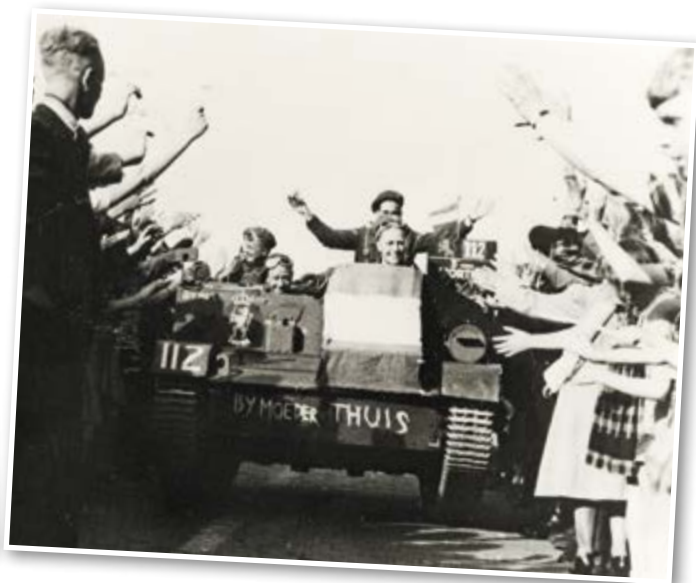
Een Bren carrier van de Brigade wordt onthaald door een jubelende menigte, 1945.