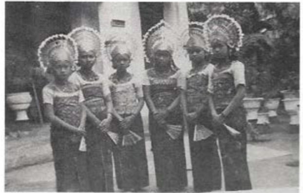
Balinese zangeresjes met optredens in Malang en Soerabaja