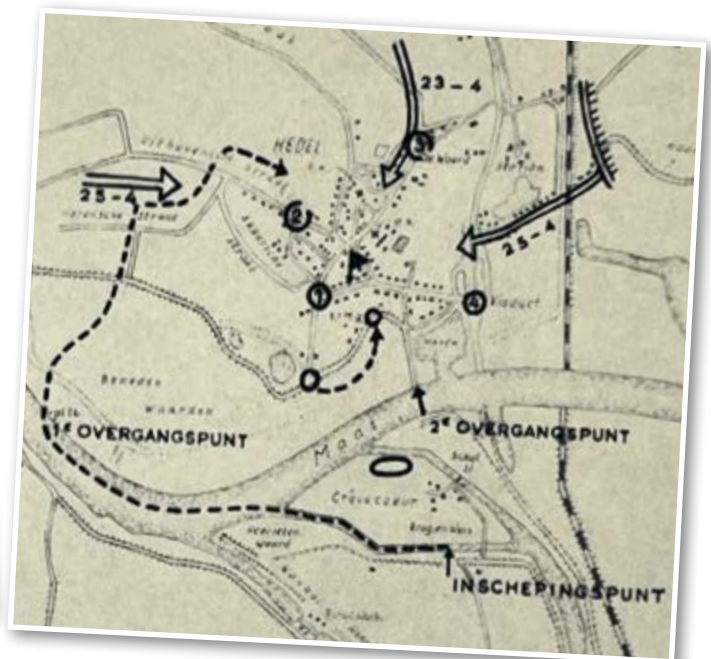
Schematische kaart van de 1e Gevechtsgroep in Hedel, 22-25 april, 1945