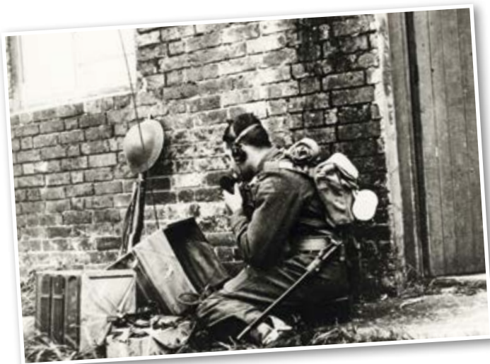
Een verbindingsman van de Prinses Irene Brigade te velde, 1944-1945