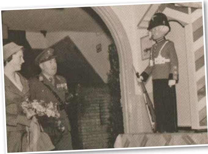
1957, Prinses Irene bezoekt de Korpsverzameling in Vught

beheer en behoud daarvan. De stichting draagt officieel de naam: "Stichting tot Handhaving van de Geschiedenis en de Traditiën der Voormalige Koninklijke Nederlandse Brigade Prinses Irene en het Garderegiment Fuseliers Prinses Irene en tot het behartigen van belangen van veteranen van bedoelde eenheden". De naam van de stichting werd om pragmatische redenen al snel verbasterd naar "Stichting Brigade en Garde Prinses Irene" (St. B&G).