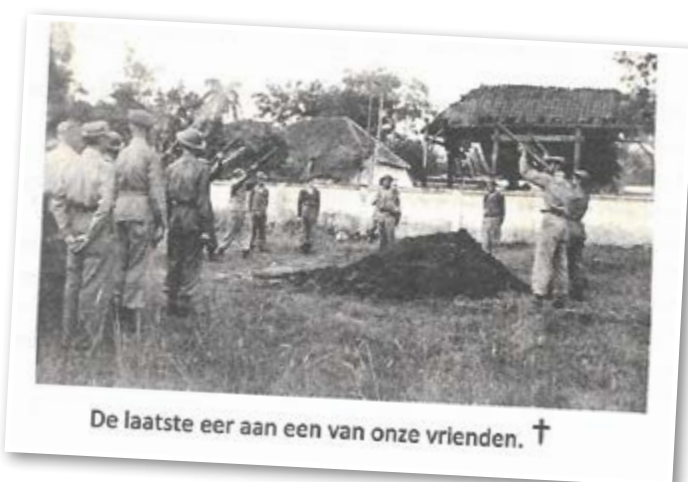
De laatste eer aan een van onze vrienden. †