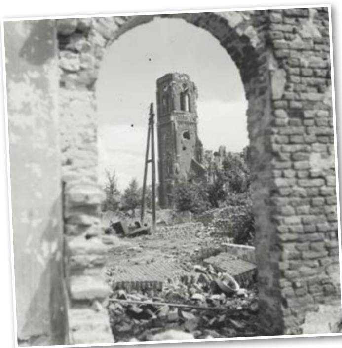
Vernielingen in Hedel na afloop van de strijd