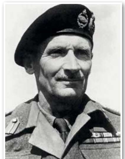
Veldmaarschalk Bernard Montgomery