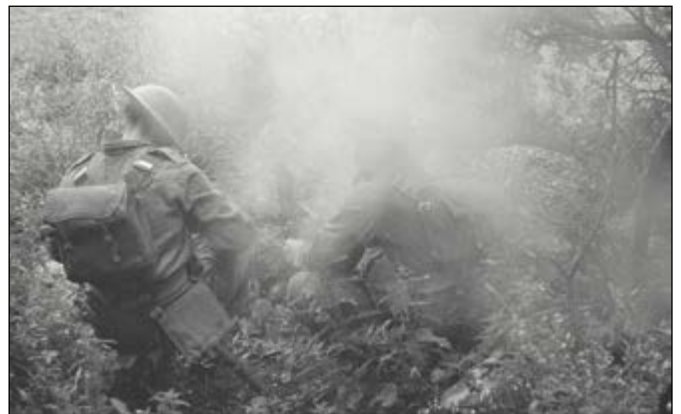
Schot met een 2 inch mortier

De 2-inch mortier was een mortier die tijdens de Tweede Wereldoorlog in verschillende varianten binnen het Britse leger werd ingezet. Een 2-inch mortier woog ongeveer vijf kilo (zonder munitie) en was daarmee veel lichter dan andere mortieren. Het wapen kon door één persoon worden vervoerd en werd door twee mensen (richter en helper, tevens munitiedrager) bediend. Ondanks zijn beperkte gewicht gaf de inzet van de 2-inch mortier naast mobiliteit een hoop extra vuurkracht. De mortier kon explosieve granaten (HE), rookgranaten en lichtgranaten afvuren met een bereik van zo'n 500 meter.