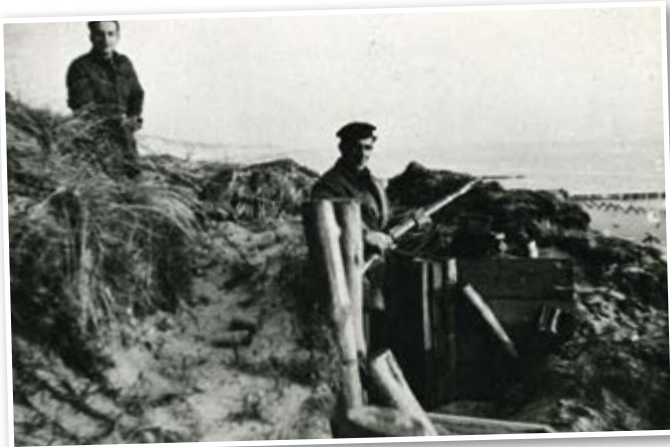
Twee Brigademannen in hun duinstellingen op Walcheren, 1944-45.

Met de beslissing de aanval door te zetten werd Operatie Orange-Deal een geïsoleerde speldenprik tegen het Duitse Festung Holland. Terwijl de Canadezen zich ingroeven tegenover de Grebbelinie maakten de Prinses Irene Brigade en de Britse mariniers zich juist klaar voor de aanval van die nacht, zich niet bewust van de zware beproeving die hun te wachten stond.