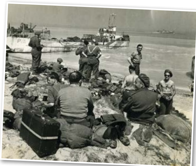
De Brigade komt aan wal in Normandië, 1944.

Maar bij de Geallieerde legerleiding werd deze visie niet gedeeld. Daar werd geoordeeld dat alle militaire middelen moesten worden geconcentreerd op een snelle opmars in Duitsland en het afdwingen van de capitulatie. Een snelle vrede was de beste remedie voor de hongersnood in West-Nederland, zo was de overtuiging. Een militair offensief richting West-Nederland met de middelen die lokaal aanwezig waren werd langere tijd overwogen, maar het concrete gevaar dat de Duitse autoriteiten de dijken zouden doorbreken en de polders onder water zouden zetten gaf uiteindelijk de doorslag deze plannen van tafel te vegen. Een militaire overwinning zou hierdoor namelijk zeer lastig worden en de humanitaire ramp nóg groter. En dus vaardigde de Britse opperbevelhebber van de 21e Legergroep, Bernard Montgomery, op 22 april een aanvalsverbod uit voor de Geallieerde troepen aan het West-Nederlandse front.