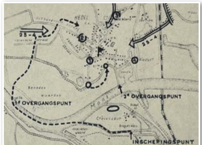
Schematische kaart van de 1e Gevechtsgroep in Hedel, 22-25 april, 1945.

Voor het complete onderzoek of andere vragen/opmerkingen kunt u mailen naar: sietsekenter@gmail.com