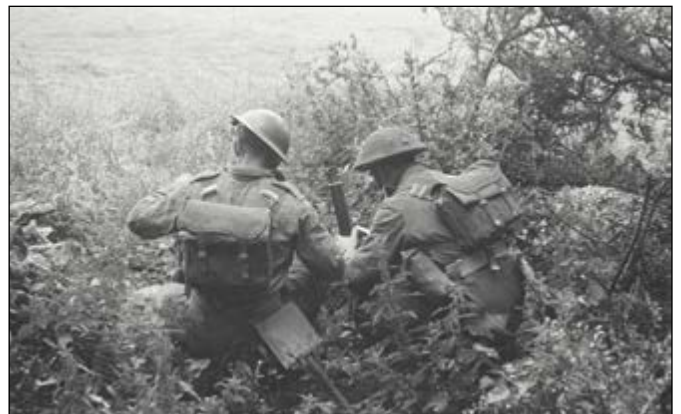
De 2 inch mortier