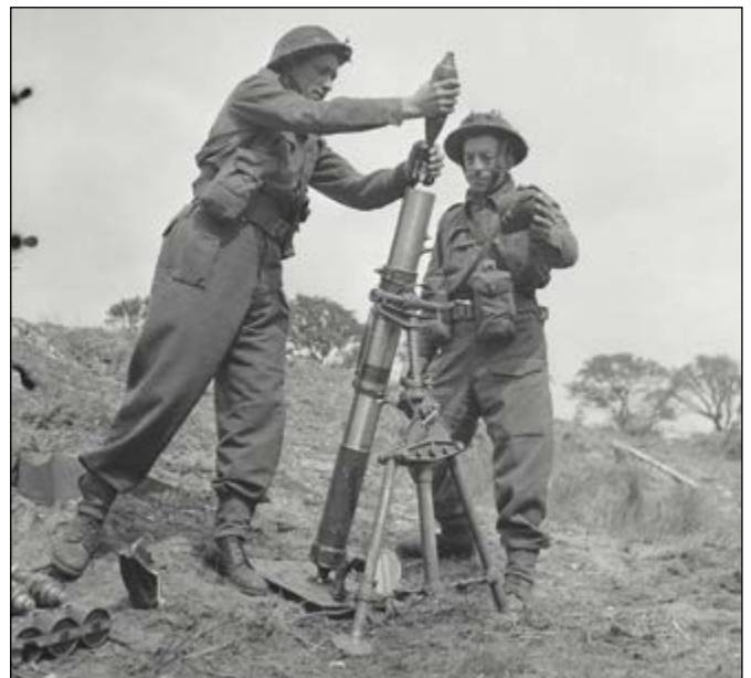
Oefenen met de 3 inch mortier

De ML 3-inch mortier (ML betekent 'Muzzle Loaded' / 'Voorlader') kon in drie pakketten door de infanterie te voet of op Universal Carriers worden meegevoerd. Uiteindelijk bleek de vernieuwde Britse 3-inch mortier een betrouwbaar en robuust wapensysteem te zijn, waarbij alle beperkingen van het oorspronkelijke model werden weggenomen of verbeterd. Met het systeem kon de stuksbe-