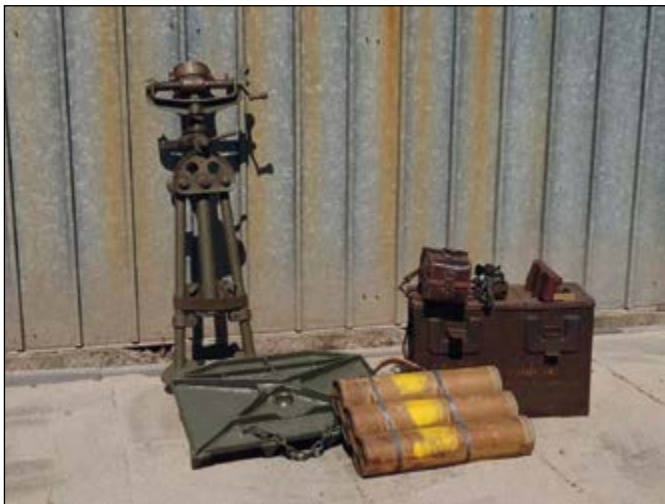
De 'Ordnance 3-inch mortar' met toebehoren

In mei slaagde de conservator van de Regimentsverzameling Brigade en Garde Prinses Irene, Hans Sonnemans, erin om via Marktplaats een aantal organieke onderdelen van een Britse 'Ordnance ML 3-inch mortar' te verwerven. Het lot betrof o.a. de grondplaat, richtmiddelen in de bijbehorende kist en organieke munitiekokers (zie foto). Een deel van deze artikelen was al in het bezit van de Regimentsverzameling, of op bruikleen van de RCKL (de schietbuis en affuit), maar m.n. de organieke grondplaat is een zeldzaamheid waar al jaren naar werd gezocht.