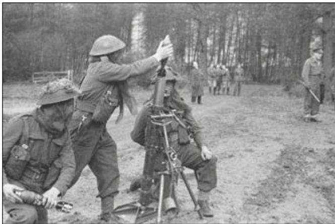
Demonstratie 3 inch mortier

De voorloper van deze mortier werd gedurende de Eerste Wereldoorlog ontwikkeld door de Britse ingenieur Wilfred Stokes. Deze 3-inch (81,2 mm) 'Stokes mortier' werd in 1917 in dienst genomen bij het Britse leger. Begin jaren dertig werd het mortier gemodificeerd, geïnspireerd door de Franse 81 mm mortier MLE 27/31, om zo het 3-inch Mark II-model te creëren. Het oorspronkelijke plan was om extra artilleriebatterijen op te richten, maar die kosten waren te hoog en deze mortier werd in plaats daarvan als standaard vuursteunmiddel bij de infanterie ingevoerd. Toen de Tweede Wereldoorlog in Europa uitbrak waren alle regimenten van het Britse leger met het 3-inch Mark II-model uitgerust.