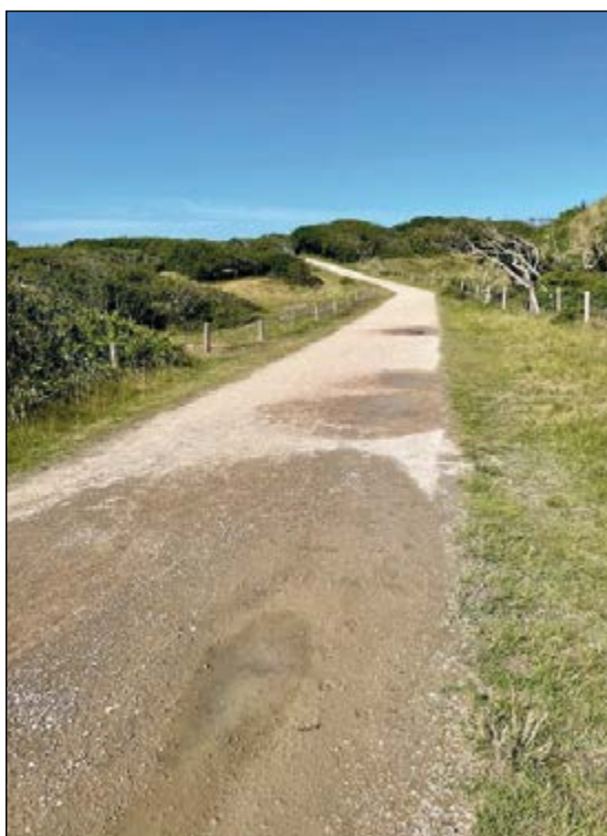
Het bewuste duinpad bij vakantiehuis De Duindistel