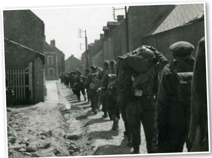
De Brigade trekt door Frankrijk, 1944.