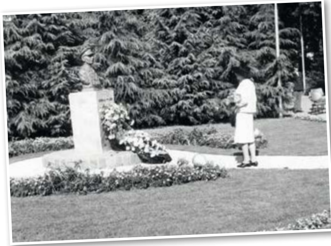
Onthulling in 1969 van het borstbeeld door de weduwe van generaal-majoor De Ruijter van Steveninck bij de ingang van de Legerplaats Oirschot