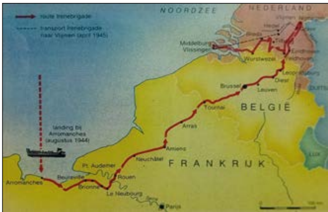
Route van de brigade