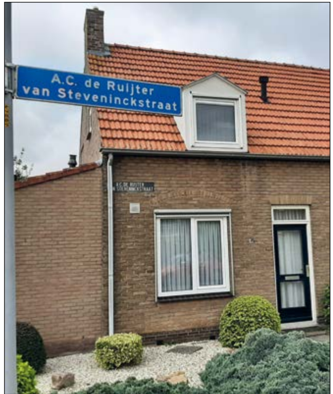
Straatnaam in Hedel met de juiste schrijfwijze van zijn achternaam (Foto R van de Velde)

Net zoals in Hedel, zou het lovenswaardig zijn als de gemeente Tiel een straat of plein naar hem vernoemd, als eerbetoon aan zijn cruciale rol in de bevrijding van Nederland