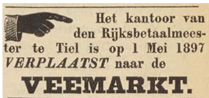
Advertentie in de Tielse Courant 1897

Zijn vader is Rijksbetaalmeester, een functie die tot 1925 in elke grote plaats of arrondissement is te vinden. Hij wordt belast met onder meer de betalingen van de salarissen en vergoedingen aan rijksambtenaren. Later wordt dat overgenomen door de Postcheque en Girodienst, beter bekend als Postgiro.