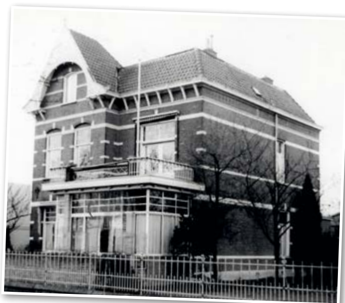
Hun inmiddels verdwenen woonhuis aan de Veemarkt in Tiel in de jaren zestig

Het gezin behoort tot de hogere klasse en is aangesloten bij de Remonstrantse Hervormde kerk. Tussen 1895 en 1901 woont het in Tiel, op de Veemarkt. Hier was in 1897 in hun fraaie woning ook het kantoor van zijn vader gevestigd.