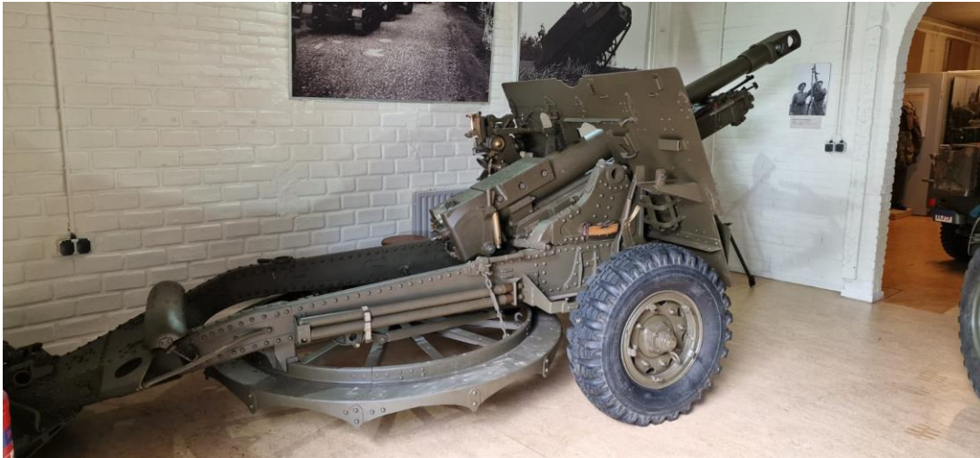
De "nieuwe 25-Ponder" in gebouw 8 (zie blz. 23)