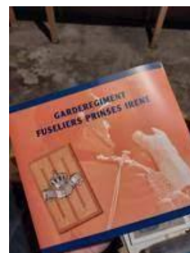
Een tweetal eerdere edities van het Regimentsboek