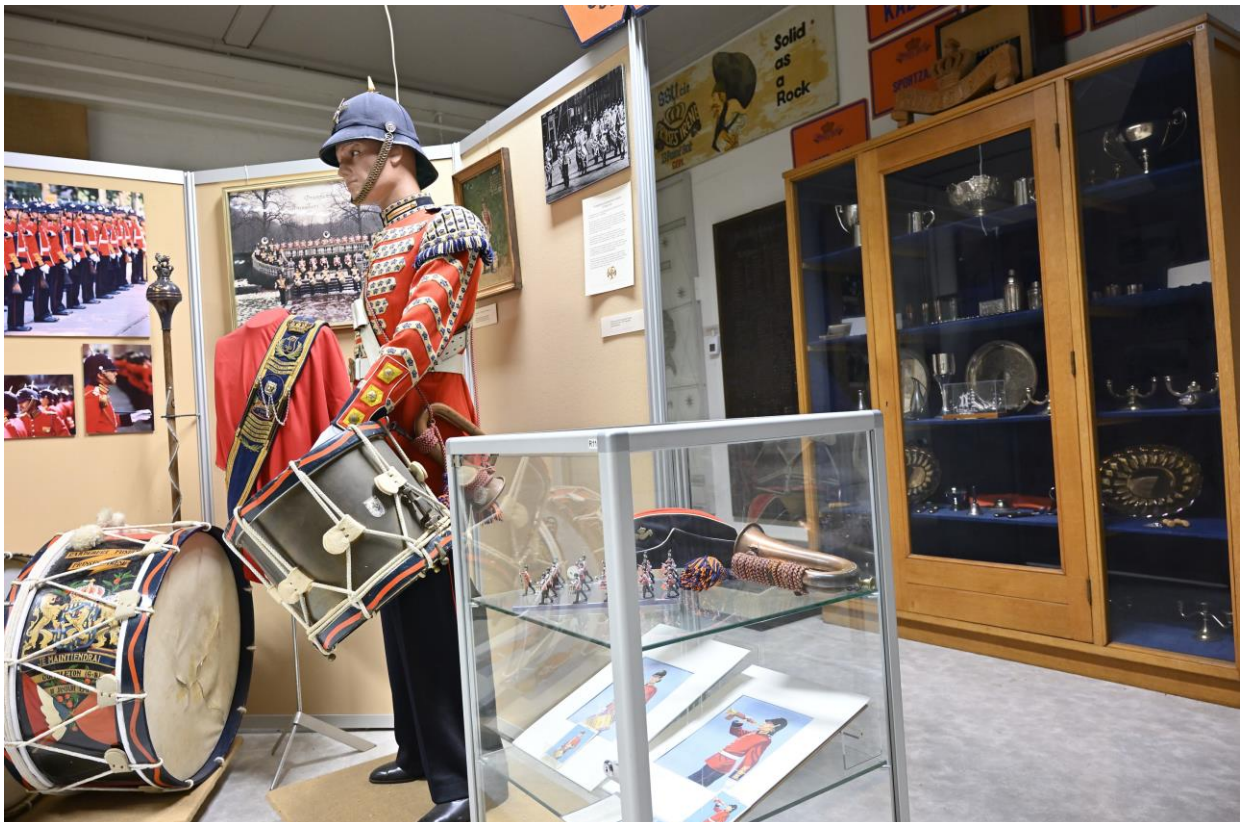
Beeld van de expositie (Tamboerkorps GFPI) in gebouw 28

Punt voor een later tijdstip in deze of de volgende beleidsperiode.