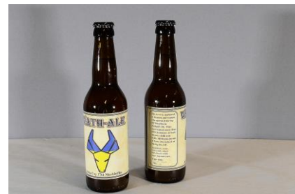
De herinneringsmedailles en het bijbehorend certificaat en de bierflesjes "Operatie Interflex"