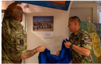
De onthulling van de foto