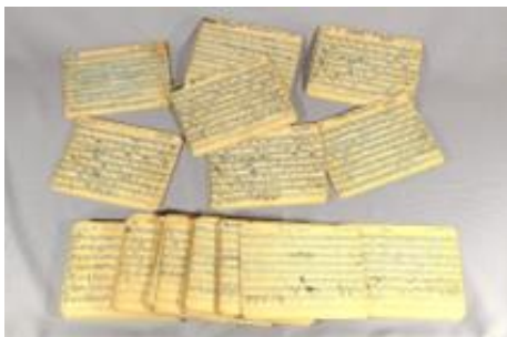
De handgeschreven partituren

Door zijn nabestaanden werd de handgeschreven bladmuziek (voor elk instrument) voor de Mars van de Prinses Irene Brigade geschonken evenals één van zijn mouwepauletten (Kapelmeester).