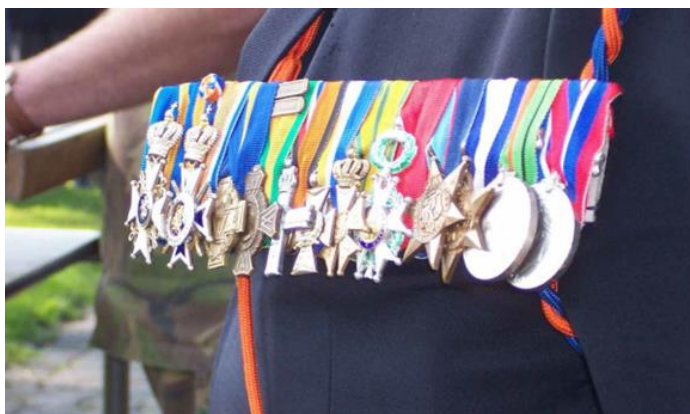
De unieke spang met onderscheidingen