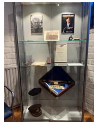
de nieuwe vitrine