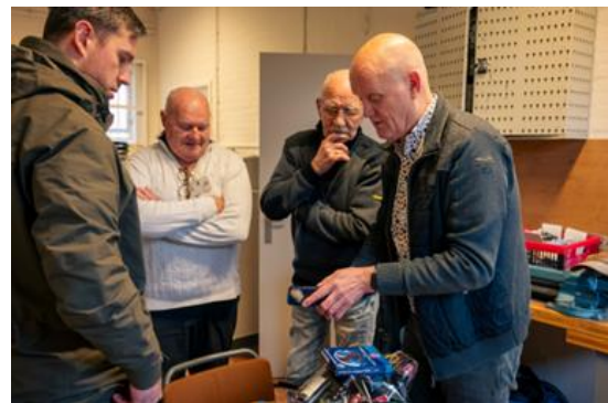
Allemaal blijde gezichten op de Nationale Vrijwilligersdag