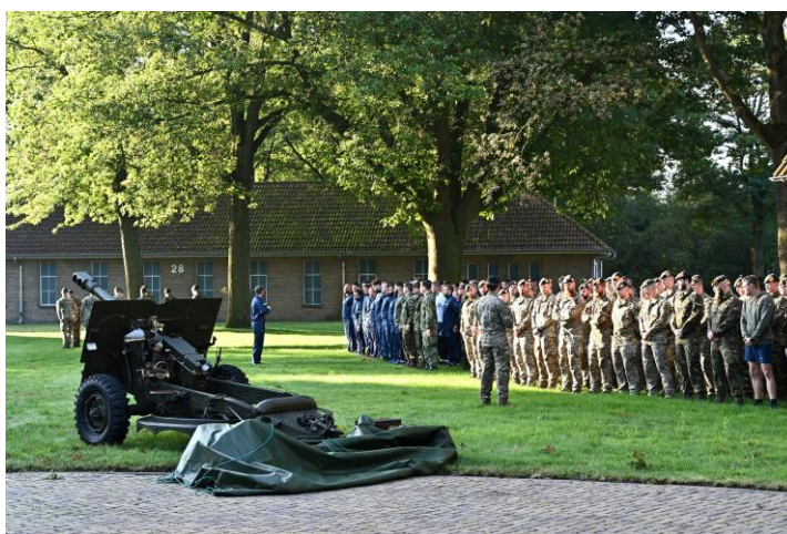
De overdracht van de 25-ponder incl. het "laatste schot" door personeel van 13 Herstelcompagnie