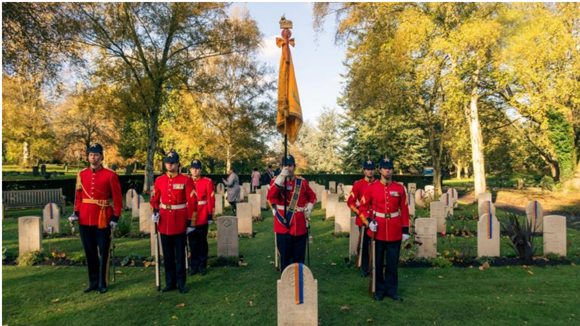
De vaandelwacht bij de jaarlijkse herdenking in Wolverhampton (Engeland, nov 2023)

De wapens, die in eigendom deel uitmaakten van de Regimentsverzameling, zijn in 2014 overgedragen aan de Rekvisieten Commissie Koninklijke Landmacht (RCKL). De, daar onklaar gemaakte, vuurwapens zijn daarna in bruikleen teruggekregen en zichtbaar in de huidige expositie.