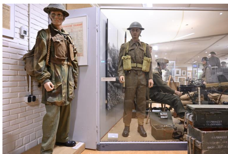
Beeld van de expositie (WO 2) in gebouw 8