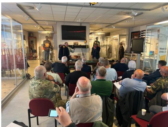
Vergadering CCKL op 5 juli

Op 5 juli werd een vergadering CCKL gehouden bij de Historische Collectie Garderegiment Grenadiers en Jagers op de Oranjekazerne in Schaarsbergen. Op 15 november vond een tweede vergadering plaats bij de Historische Collectie Regiment Stoters en Stoottroepen Prins Bernhard in Assen. Namens de Regimentsverzameling was de conservator bij beide vergaderingen aanwezig.