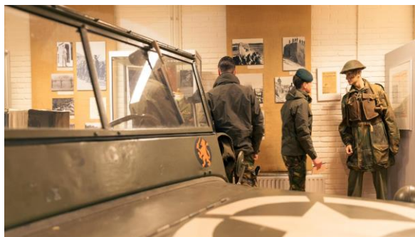
Aandacht voor de regimentsgeschiedenis