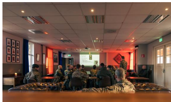
Een onderdeel van de traditiedag (presentatie)