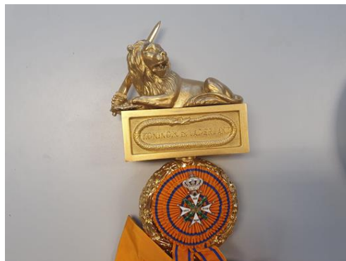
Foto bevestiging Militaire Willemsorde aan het Vaandel GFPI (oud (links) en nieuw)