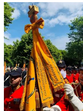
De bevestiging van de cravate door Z.M. de Koning en een foto van de cravate.