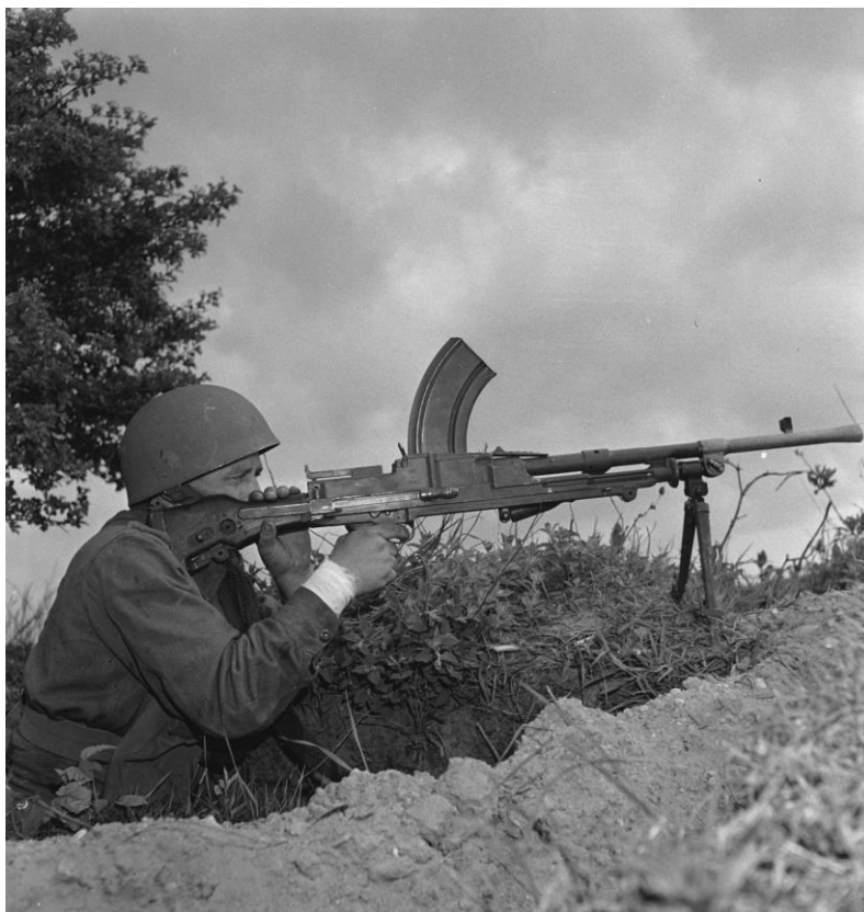
Een Brenschutter van de Koninklijke Nederlandse Brigade Prinses Irene