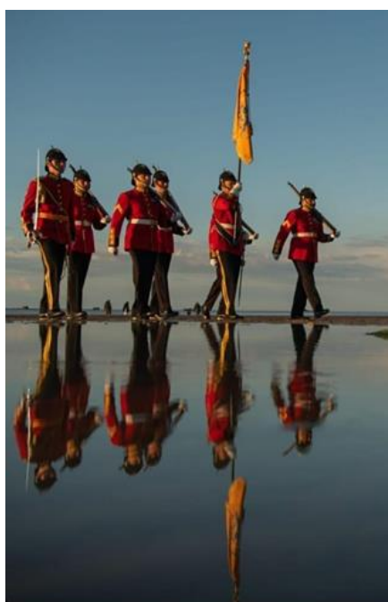
De Vaandelwacht in Normandië (juni 2022)