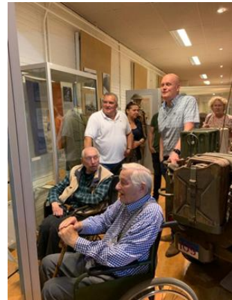
Het bezoek van de familie van Vlijmen.