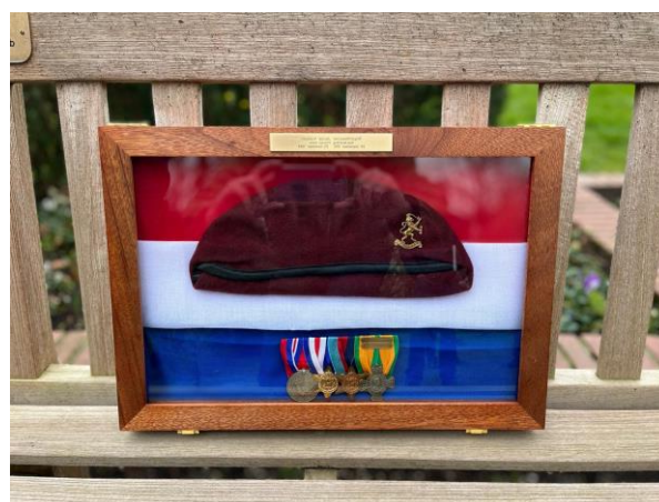
Oud-strijder Frans van der Meeren en de baret met model opgemaakte onderscheidingen