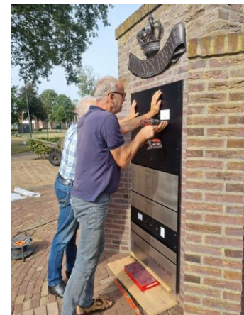
De oude plaquette en het monteren van de nieuwe plaquettes.