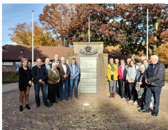
De vrijwilligers van museum Hedel's Historie.