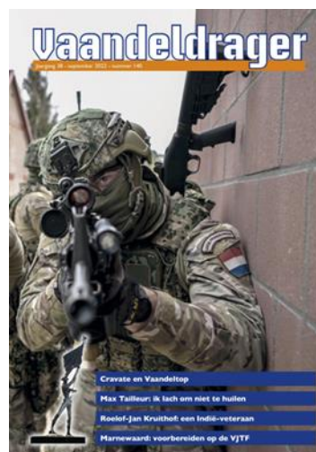
Vaandeldrager 139 en 140