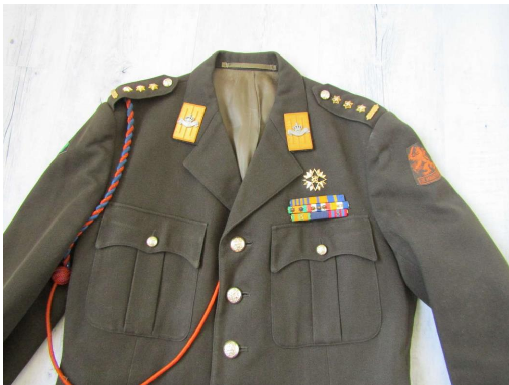
Jas DT incl. invasiekoord, brevet Hogere Krijgsschool (HKS) en batons