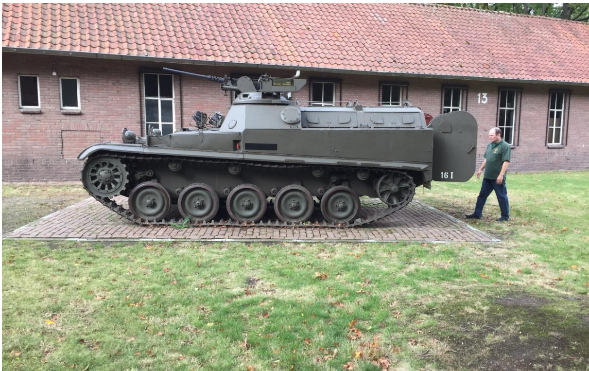
De AMX van de Historische Verzameling Limburgse Jagers op het Historisch Eiland. De AMX is ook in gebruik geweest bij 17 Painbat toen dit nog registratief behoorde tot het Regiment Chassé.

Gebouw 95 (het oude poortgebouw) ligt in de directe omgeving van de Regimentsverzameling Brigade en Garde Prinses Irene en de invulling hiervan kan op termijn leiden tot een betere ontsluiting, of eenvoudigere toegang tot het historisch eiland. Op het historisch eiland bevindt zich ook de Historische Verzameling van het Regiment Limburgse Jagers incl. hun monument en enkele poortwachters (o.a. AMX Pri en YPR 765 Pri).