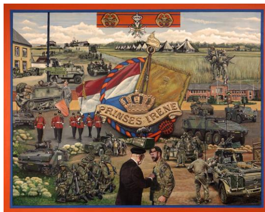
Het schilderij van kunstenaar Jos Gelissen.

Door de Regimentsadjutant 17 Painfbat GFPI D.M. van de Wijngaart werd een schilderij aangeboden aan het Regiment. Het schilderij is gemaakt door schilder en kunstenaar Jos Gelissen, het thema is de doorontwikkeling van de Koninklijke Nederlandse Brigade Prinses Irene naar het huidige parate bataljon. Het schilderij heeft dezelfde stijl en grootte als het schilderij "Uitzendingen en inzet GFPI" dat in 2016 door de veteranenvereniging VVVGFI werd aangeboden. Het schilderij is opgenomen in de Regimentsverzameling en heeft een prominente plaats gekregen in het stafgebouw van 17 Painfbat GFPI.