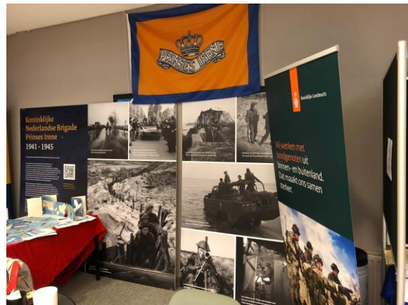
Het (her)gebruik van de "story boards" bij de mini-expositie in Dongen.