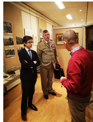
Samen met de Defensie Attache.