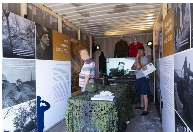
Overzicht inrichting container op 31 augustus in Terneuzen.

Bij de herdenking van de Slag om Schelde en de start van "75 jaar bevrijding" in Terneuzen op 31 augustus werd een informatiepunt ingericht over de rol van de Koninklijke Nederlandse Brigade Prinses Irene tijdens de Tweede Wereldoorlog (m.n. de gebiedsbeveiliging op Walcheren) en het huidige Garderegiment Fuseliers Prinses Irene. Voor de inrichting van het informatiepunt werd samengewerkt met de HC van het Korps Commandotroepen en de HC van het Regiment Stoottroepen Prins Bernhard.