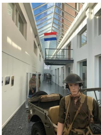
Museum 't Oude Slot Veldhoven.