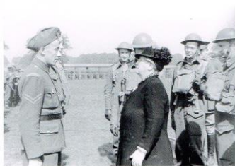
Ter Ere van de Irene Brigade 31 aug – 06 sept 2019

In september vond de fietstocht van het Wounded Warriors Cycling Team van Normandië naar Oirschot plaats. De fietstocht i.h.k.v. 75 jaar bevrijding werd gereden "ter ere van de Prinses Irene Brigade" en volgde grotendeels dezelfde route als de opmarsroute van de Koninklijke Nederlandse Brigade Prinses Irene tijdens de veldtocht door West-Europa in de Tweede Wereldoorlog. De fietstocht eindigde op 6 september op de Genm de Ruyter van Steveninckkazerne met een kranslegging bij het GFPI-monument, maaltijd in de Regimentsmess Congleton en een bezoek aan de Regimentsverzameling Brigade en Garde Prinses Irene.