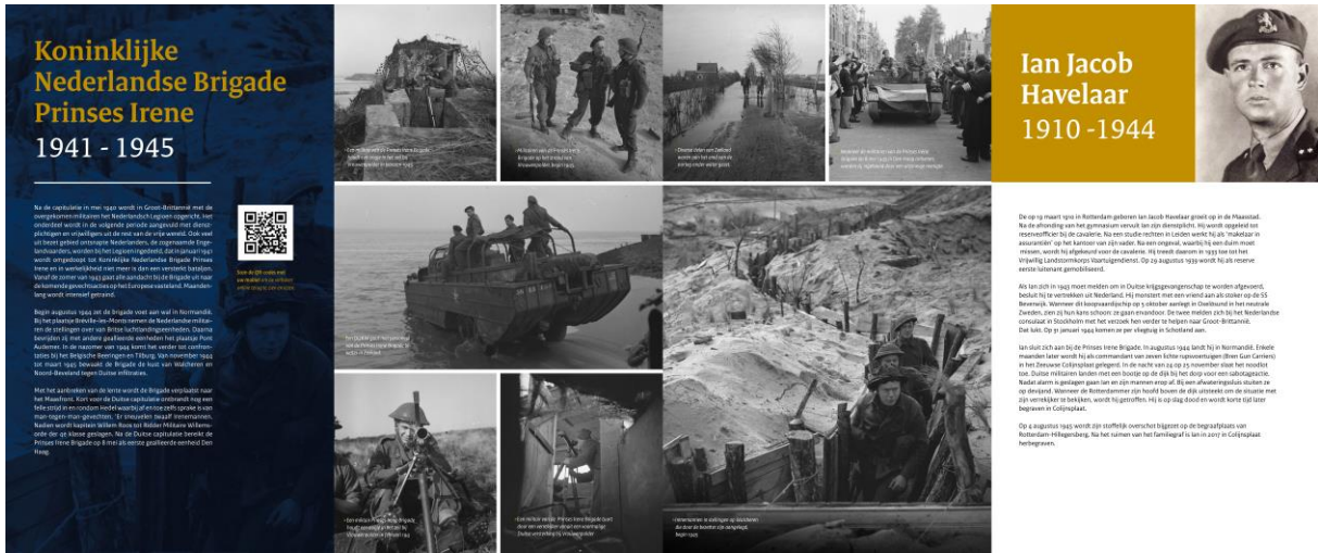
Het overzicht van de gehele presentatie op de story boards in Terneuzen.

Deze "story boards" over inzet van de Koninklijke Nederlandse Brigade Prinses Irene in Zeeland 1944/1945 zijn daarna geschonken aan de Regimentsverzameling Brigade en Garde Prinses Irene en werden en worden gebruikt in de diverse (tijdelijke) exposities gerelateerd aan de krijgsverrichtingen van de Koninklijke Nederlandse Brigade Prinses Irene en 75 jaar bevrijding.