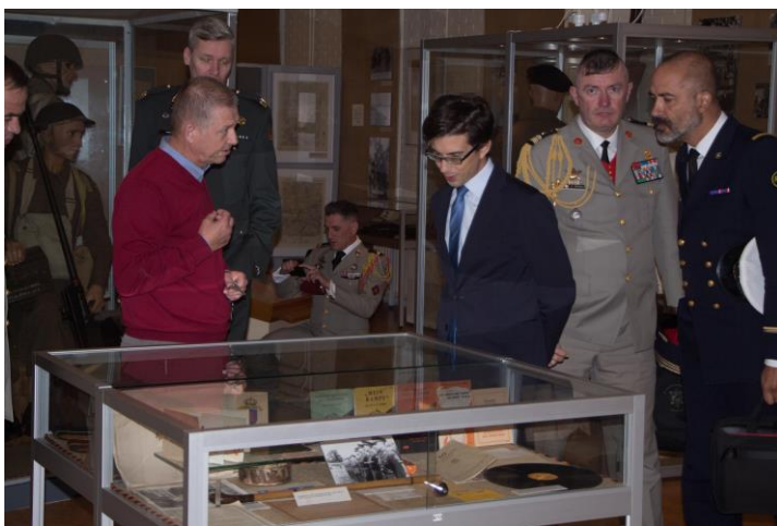
Rondleiding en uitleg aan de Franse Ambassadeur.