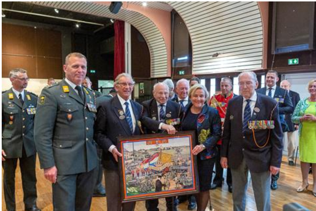
Het aanbieden van een kopie aan Minister van Defensie Mevr. Ank Bijleveld.

Op 6 juni werd in Frankrijk door de Regimentscommandant Luitenant-kolonel H. Gorissen - samen met een aantal veteranen van de koninklijke Nederlandse Brigade Prinses Irene - een kopie van het schilderij aangeboden aan de Minister van Defensie, Mevr. Ank Bijleveld, en aan de burgermeester van Arromanches.