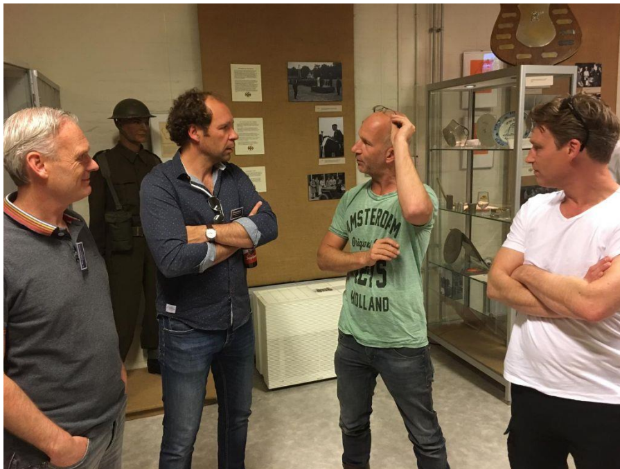
De reünisten (ex-dienstplichtigen) liplg 92/4 halen herinneringen op.