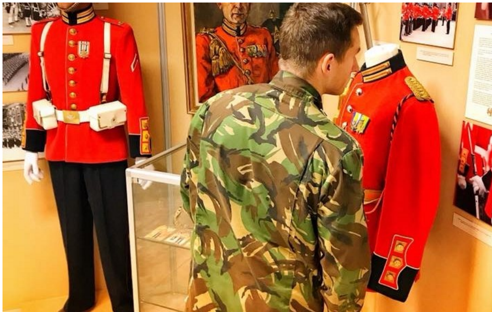
Nieuw geplaatste Fuselier aandachtig bezig met de uitvoering van zijn "Rode Patten" test.