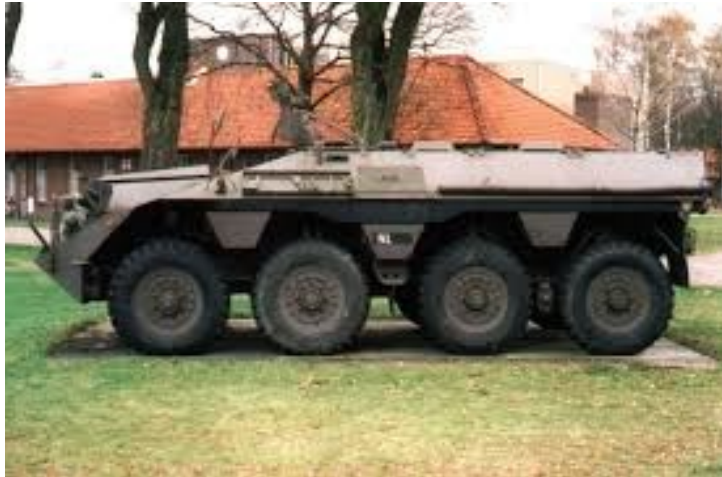
DAF YP408 PWI

tussen het museum en de Regimentsmess "Congleton" gelegen monument.