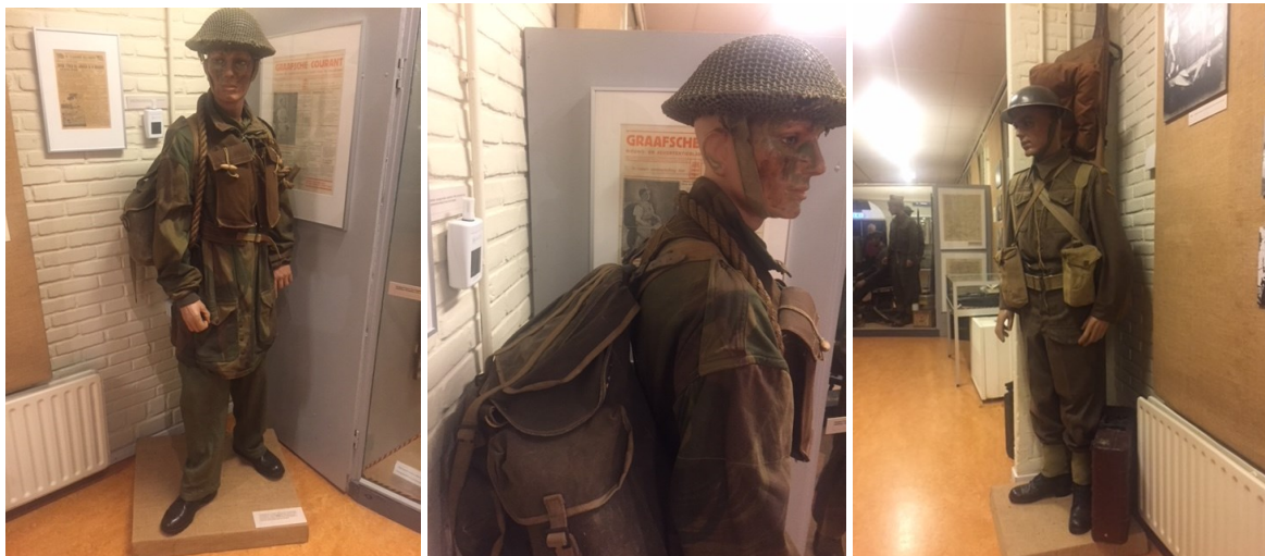
Foto links en midden betreft de commando-figuur en de rechtse foto betreft de hospik met stretcher.