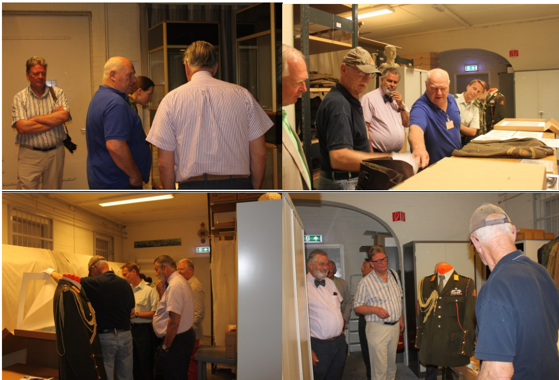
Een foto-impressie van het bezoek CCKL/TCKL op 20 juni