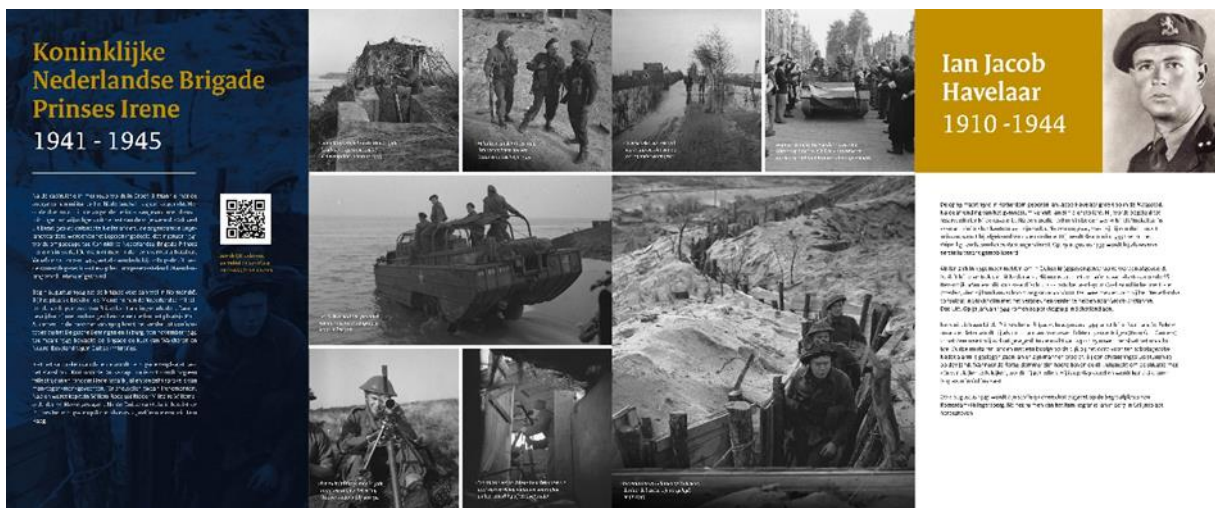
Presentatie bij de opening 75 jaar bevrijding op 31 aug 2019 in Terneuzen.

Vooraf tijdens de herdenkingen en vieringen i.h.k.v. “75 jaar Vrijheid” (2019/2020) zal er een extra beroep worden gedaan op de Regimentsverzameling en haar vrijwilligers. Het bestuur ziet dit mede als een kans om haar doelstelling te verwezenlijken en draagt er zorg voor dat er toereikende financiële middelen zijn om deze activiteiten uit te voeren en te ontwikkelen.