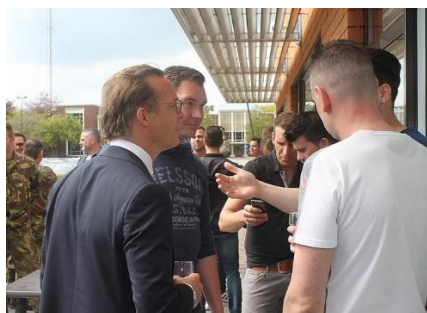
Prins Jaime in gesprek met veteranen tijdens een reünie.

De binding met het Koninklijk Huis wordt jaarlijks rond de verjaardag van Zijne Majesteit de Koning concreet benadrukt door de zogenaamde 'Bloemenhulde', waarbij een vertegenwoordiging van het Garderegiment Fuseliers Prinses Irene, in beginsel onder leiding van de Regimentscommandant, tezamen met een deputatie van de Garde Grenadiers en Jagers, het geheel onder leiding van de Gardecoördinator, een bezoek brengt aan Zijne Majesteit de Koning ten paleize. Bij die gelegenheid bieden de Garderegimenten aan Zijne Majesteit een mand met bloemen aan en spreekt de Koning met de vertegenwoordigers van de Garderegimenten.