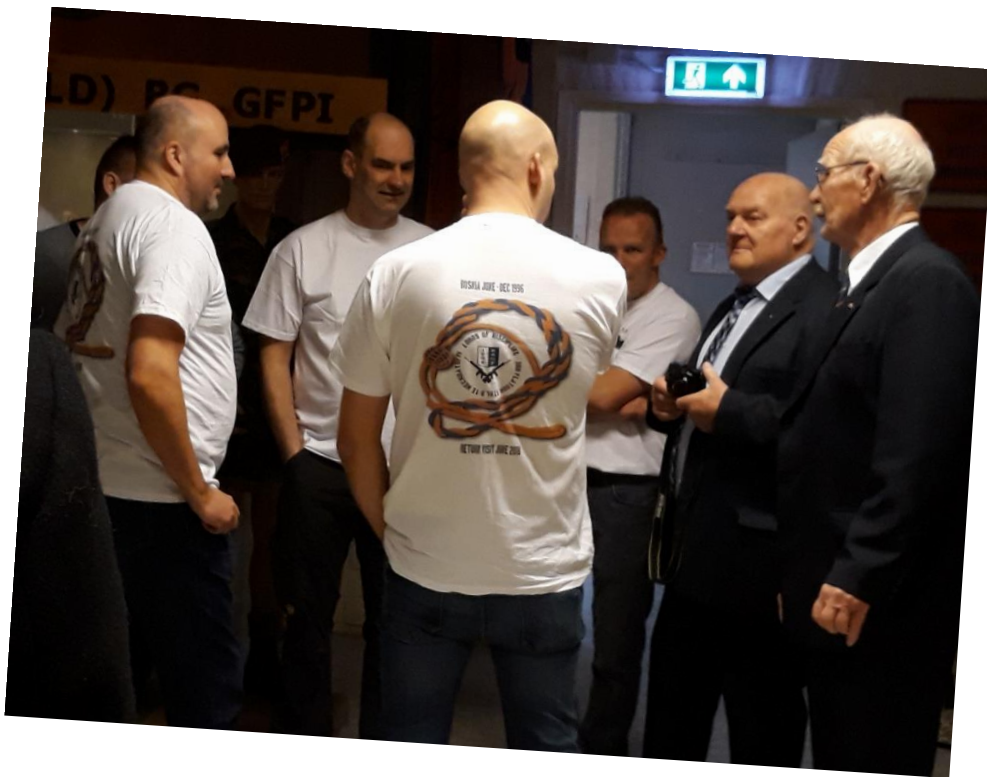
Rondleiding door de HC-vrijwilligers aan reünisten IFOR 2

De taakgerichte of werkinhoudelijke begeleiding spitst zich toe op vergroting van de deskundigheid van de vrijwilligers. Deze taakgerichte deskundigheidsbevordering kan afhankelijk van het onderwerp, individueel of in groepsverband georganiseerd worden. In beginsel wordt elke vrijwilliger in de gelegenheid gesteld dan wel gestimuleerd om deel te nemen aan instructie, training of scholing. Dit omdat deelname aan deskundigheidsbevordering niet altijd verplicht opgelegd kan worden en niet voor elke vrijwilliger noodzakelijk of wenselijk is.