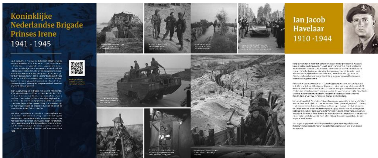
Presentatie bij de opening 75 jaar bevrijding op 31 aug 2019 in Terneuzen.

Vooraf tijdens de herdenkingen en vieringen i.h.k.v. “75 jaar Vrijheid” (2019/2020) zal er een extra beroep worden gedaan op de Regimentsverzameling en haar vrijwilligers. Het bestuur ziet dit mede als een kans om haar doelstelling te verwezenlijken en draagt er zorg voor dat er toereikende financiële middelen zijn om deze activiteiten uit te voeren en te ontwikkelen.